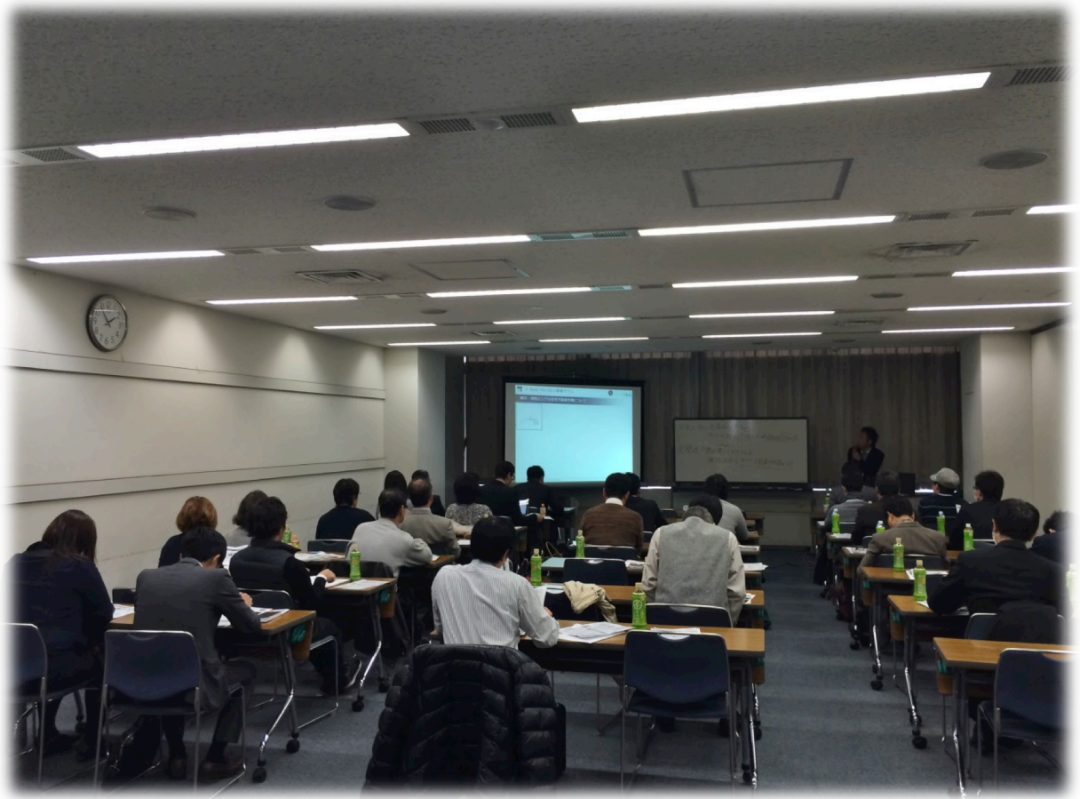
2015 年 1 月に東京都内で開催した事業者向けセミナーの様子